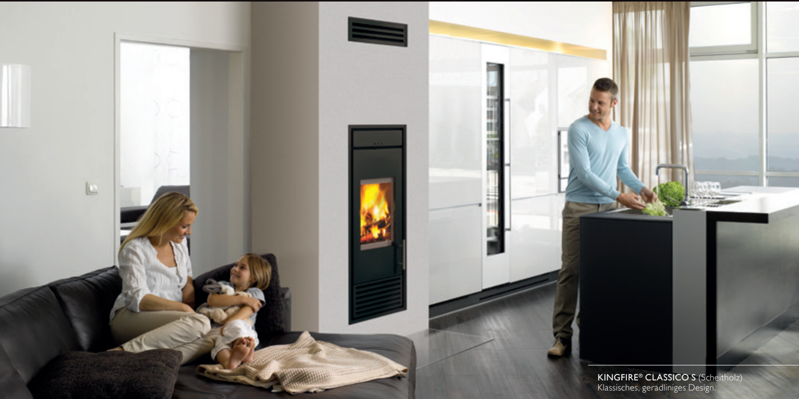
KINGFIRE® CLASSICO S (Scheitholz) Klassisches, geradliniges Design.